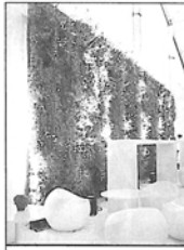
Greenwall fait aussi les intérieurs.